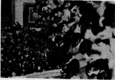
Notre laborieuse amesse de Joinville a organisé y fait nombreux si on en juge par la foule de mille jolis chocs.

C'est dans une joyeuse ambiance que les organisateurs distribuèrent à la salle de la Halle aux Tabacs, quelques jouets à leurs enfants. Auparavant, de succulents gâteaux, d'appétissantes friandises et un chocolat bien chaud avaient précédé cette distribution effectuée autour d'un immense Arbre de Noël brillamment illuminé. Félicitations tous les responsables de cette fête à réussite.