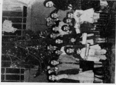
Les jeunes locaux de l'E.C.A. ont offert goûter, friandises et boissons à l'occasion de la fête de Noël. Ils ont exprimé leur joie et leur reconnaissance en gestes touchants. L'Arbre de Noël édifié à cette occasion avait grande allure.