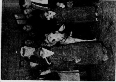
Monté sur un âne gris également escorté, le Père Noël des Policiers fait une entrée triomphale dans la salle des Amis Réunis où l'attend un nombreux public. (Compte rendu en page 10).