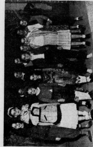
Les jeunes des Mouvements catholiques vicennes d'interprètes satiriques et sèches et semblent faire des lecteurs de "Tel". Quelques instantes plus tard, frondeurs, gâteux et jouets allaient faire des heures.

Vous la retrouvez. Blidéans, votre gare exige, votre gare insuffisante qui, entre, et se, et six, à l'heure du thé — que dis-je ? de l'amiette, pose souvent de très graves problèmes, car c'est l'heure où tous les trains arrivent à la fois. Il faut faire attendre les voyageurs pour laisser passer les autres cars, pour reconnaître, l'indifférence des usagers si tout va bien, ou bien la tempête de récriminations si tout va mal. C'est ce petit coin de Blida qui a reconstruit sur l'espace de quelques kilomètres carrés, pour le plaisir de vos yeux.