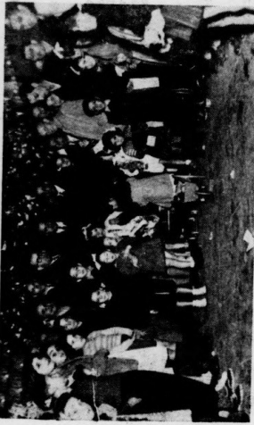
Les enfants de l'H.P.B. se présentent autour de l'arbre de Noël scintillant de lumières, devant MM. Boumelt, Dédouche et le Docteur Romaric.